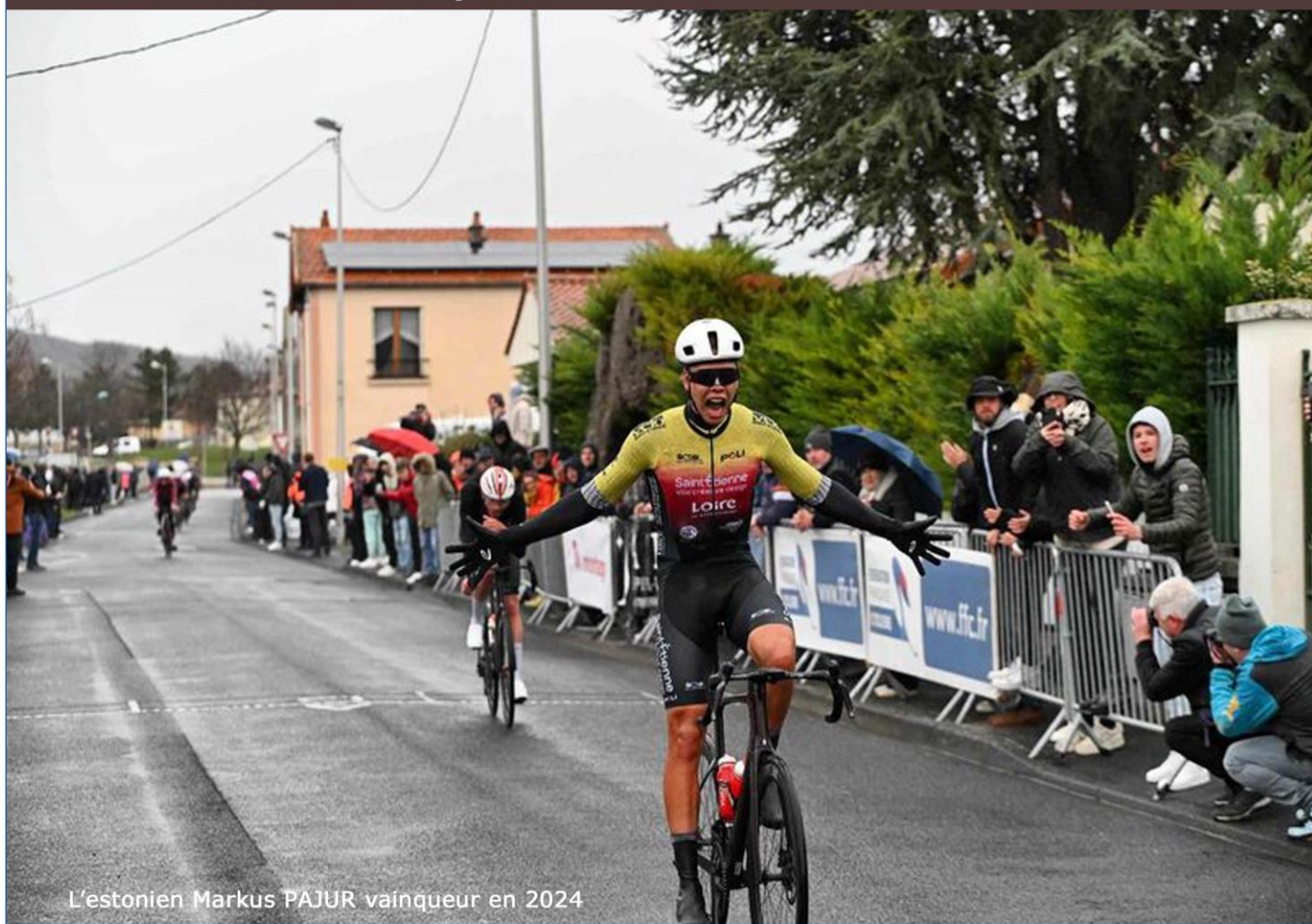
L'estonien Markus PAJUR vainqueur en 2024

CIRCUIT: Châteaugay - Sayat - Durtol Nohanent - Blanzat - Cébazat - Châteaugay soit 20,3 km à parcourir 6 fois soit 121,8 km